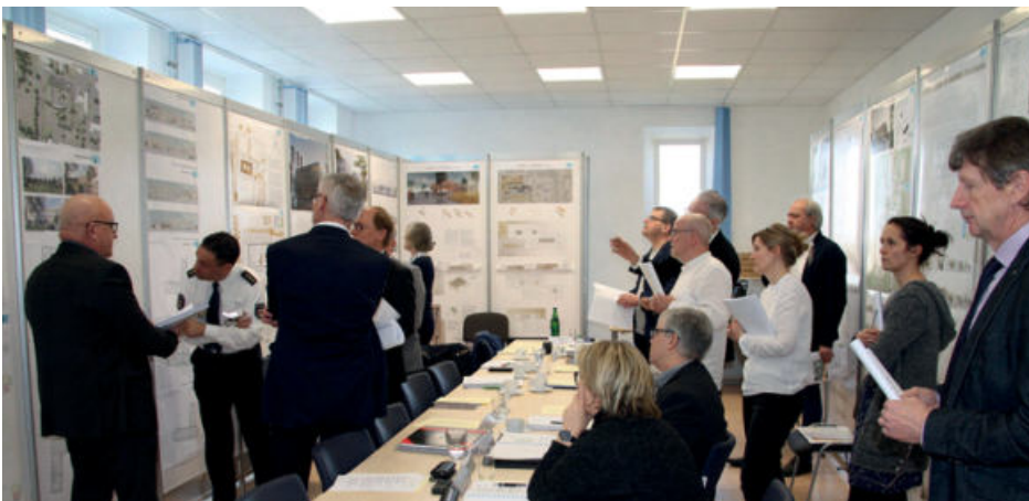
Das Preisgericht im angeregten Gespräch

Die BHBVT Gesellschaft von Architekten mbH aus Berlin und die JSP Architekten Gesellschaft für Gesamtplanung mbH aus Dresden erhielten eine Anerkennung. ■