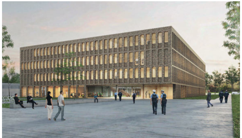
Fotos (2): 2020, Huber Staudt Architekten BDA Gesellschaft von Architekten mbH Berlin

25 Architekturbüros aus Deutschland und der EU bewarben sich um die Teilnahme am Wettbewerb. Nach Eignungs-